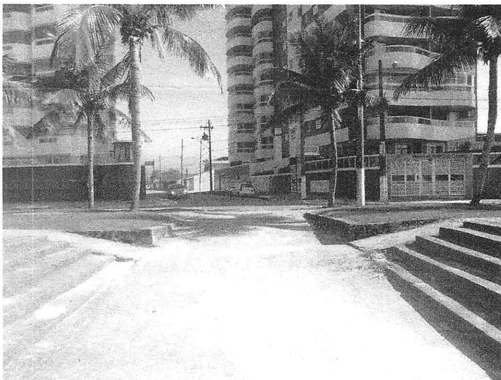
Av.: Presidente Castelo Branco (enfrente Rua: Anita Barreira) - Maracanã