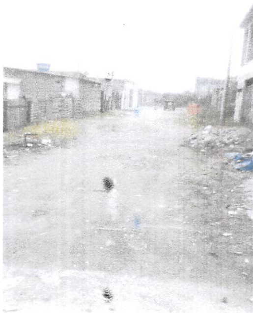
Travessa 10 - Melvi