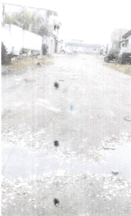
Travessa 13 - Melvi