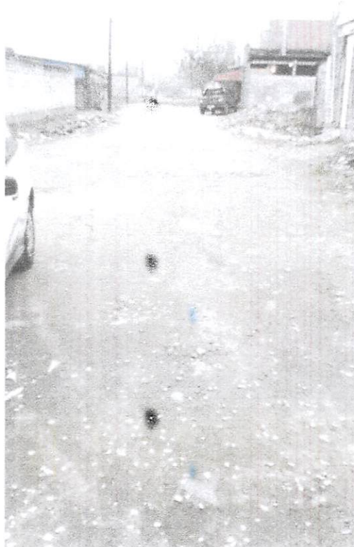
Travessa 14 - Melvi