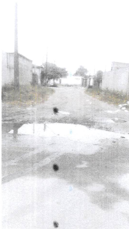
Travessa 12 - Melvi