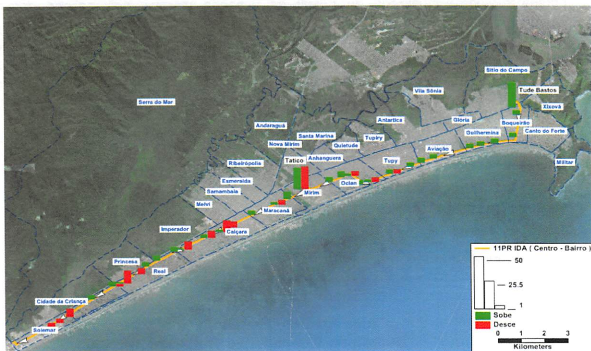
Figura 1 - Mapa da linha 11PR Ida, sentido centro-bairro (perfil de sobe e desce)

A linha 11 PR, tem o seu o carregamento ao longo da linha, de acordo com os dados obtidos pela pesquisa de sobe e desce, conforme mostra abaixo. Com os dados das pesquisas é possível determinar o perfil da linha. Nos gráficos apresentados, nota-se o perfil da linha, em cinza, e os passageiros que sobem e descem em cada ponto, permitindo a identificação dos picos de carregamento, os trechos mais constantes, entre outras coisas. Esse perfil representa o perfil de uma viagem típica no período pico manhã da cidade.