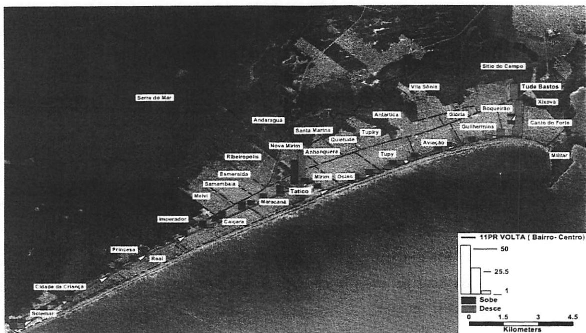
Figura 2 - Mapa da linha 11PR volta, sentido bairro-centro (perfil de sobe e desce)

Em função das pesquisas de transportes a linha 11 PR, teve sua programação horária revisada e atualizada, em função da demanda nos dias úteis, sábado, domingo e feriados. A linha 11 PR, é caracterizada por uma linha troncal, com característica diametral. Ela é a mais extensa do sistema de transporte coletivo, com 24,7 Km de ida e 25,6 Km de volta. O tempo de percurso é estimado em 65 minutos na ida e 65 minutos na volta. Ela opera com 16 veículos nos dias úteis, 11 veículos, no sábado e 08 veículos aos domingos e feriados. O intervalo médio da linha nos dias úteis, está em torno de 10 minutos, nos sábados em torno de 15 minutos e aos domingos em torno de 17 minutos.