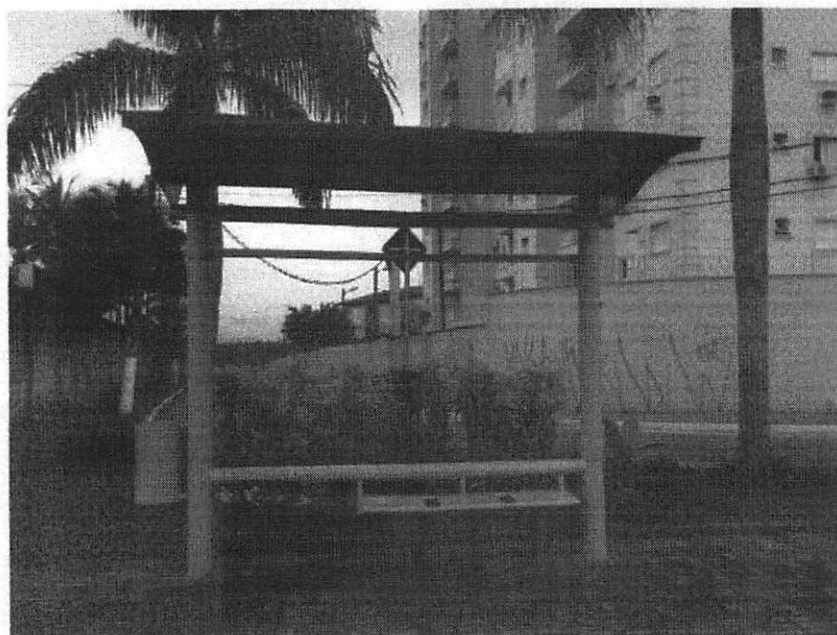
Depois em 14/11/2019, abrigo reformado