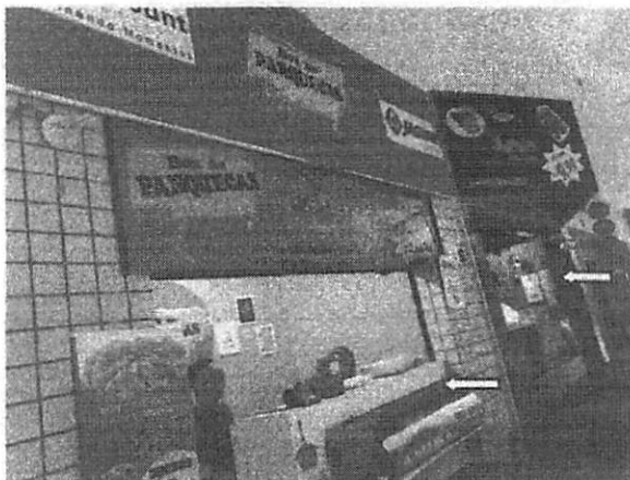
Box 3 e 4 com dois estabelecimentos