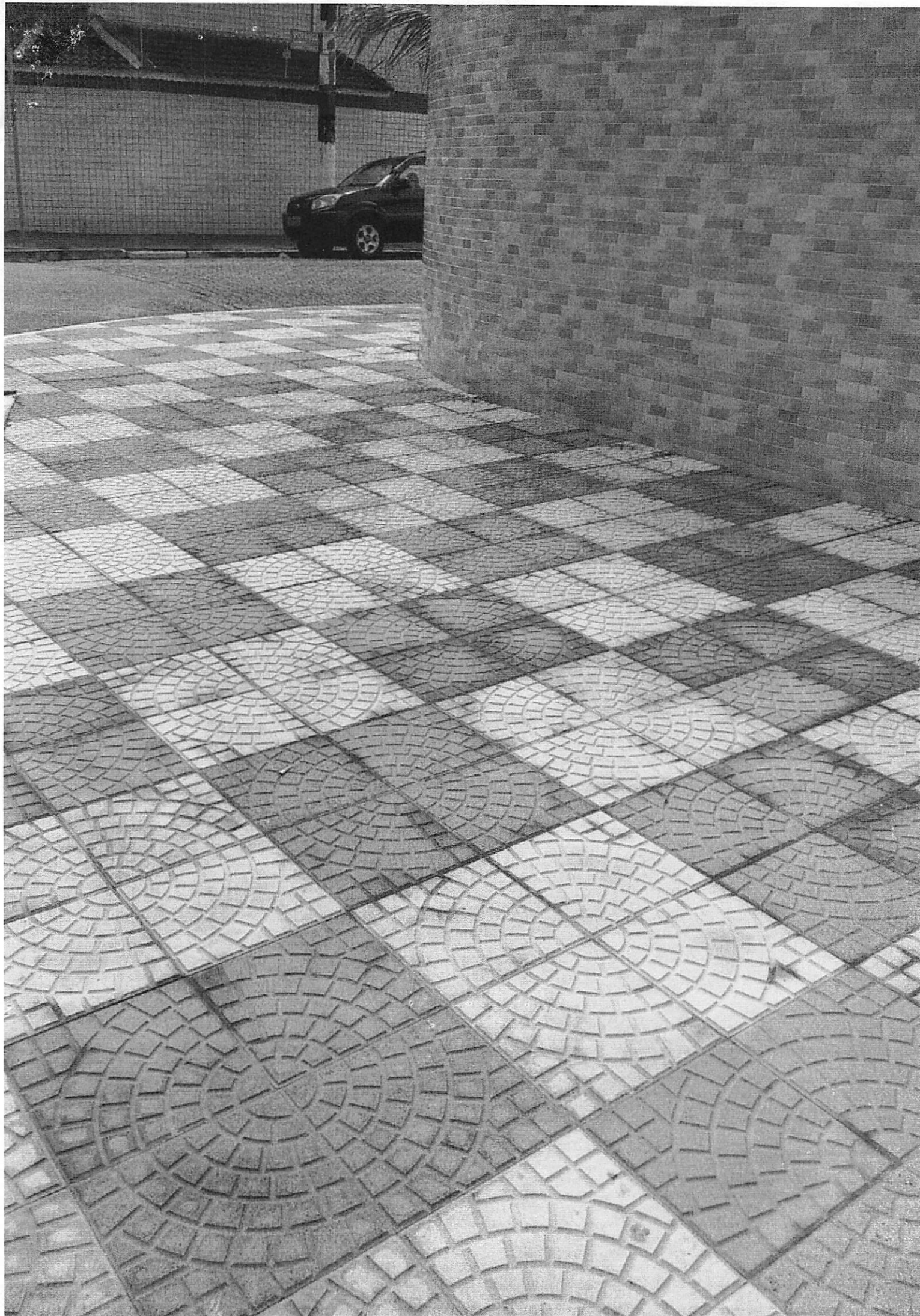
Pedra Mosaico Português (2ª opção)