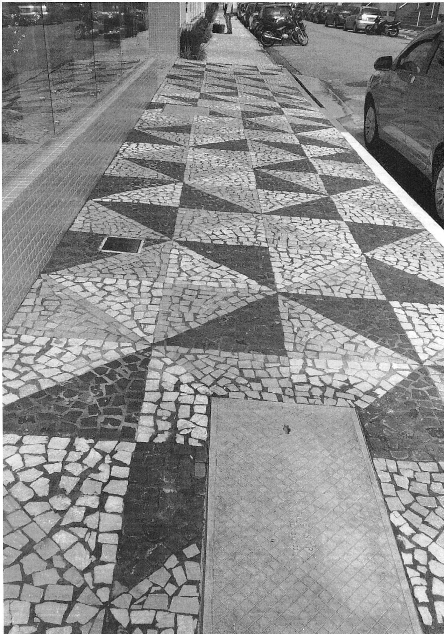
Pedras Mosaic Portuguese