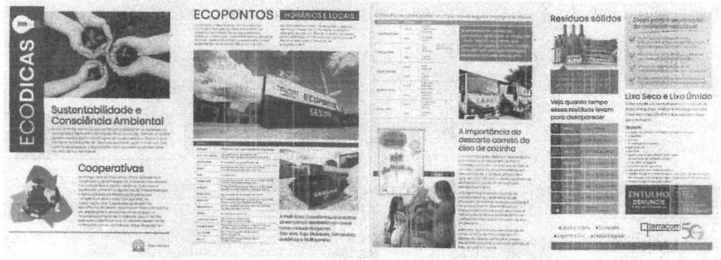
Figura 2: Informativo do Ecodicas.

No caso de denúncias, o município pode fazer pelo telefone 153 ou pelo canal da Ouvidoria Municipal, através do telefone 162 ou site oficial da prefeitura.