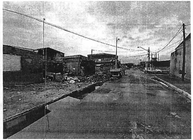
Imagem 03: notar o fechamento total da vala de escoamento pluvial