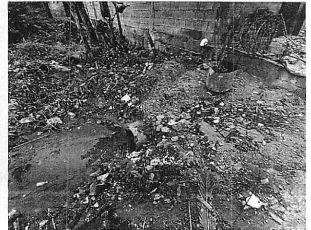
Imagem 04: foto indicando ocupação irregular além da barreira física e a trecho aterrado sobre tubo

↳ Vala aterrada irregularmente e o material de tubo de diâmetro inferior ao necessário para escoamento da via