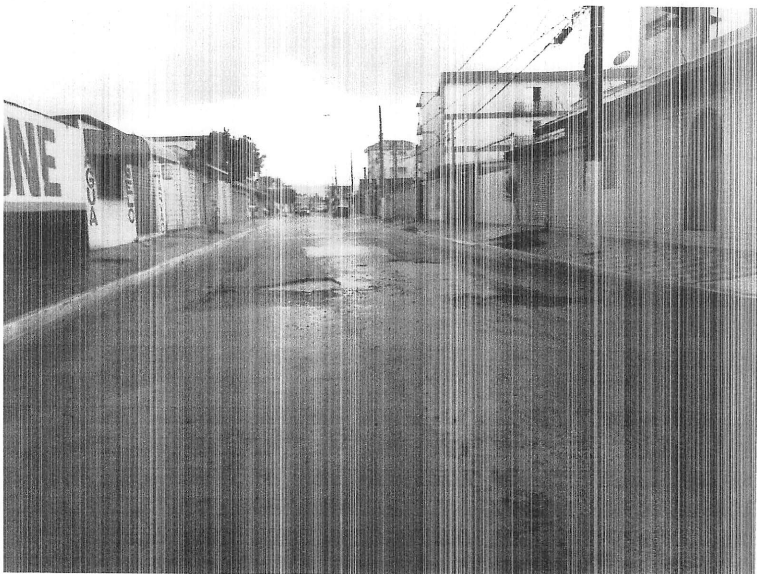
Rua Osvaldo Sampaio, bairro Aviação