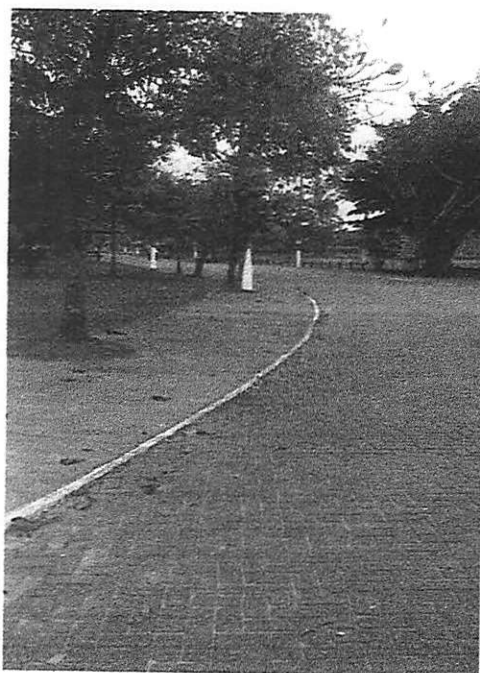
Foto: Sem sinalização