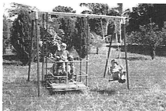
Fotos : Modelos de brinquedos para deficientes.

Sala Emancipador Oswaldo Toschi, 26 de março de 2017.