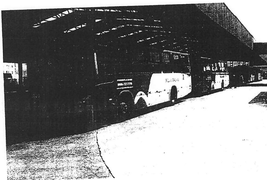
Passagem dos ônibus de Praia Grande ficará mais cara

Os moradores de Praia Grande começarão 2018 pagando R$ 0,20 a mais na tarifa do transporte público municipal. A Prefeitura anunciou na noite desta quinta-feira (28) o reajuste da passagem dos ônibus de R$ 3,85 para R$ 4,05 - aumento de 5,2%, acima da inflação - a partir da zero hora de segunda-feira (1°).