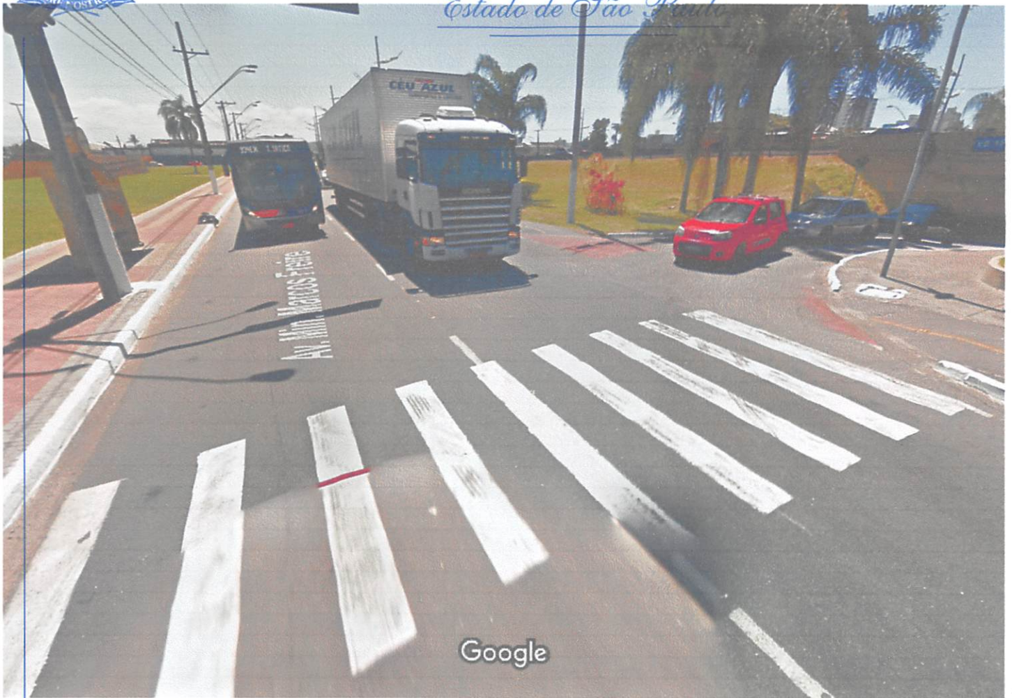
Captura da imagem: nov 2017