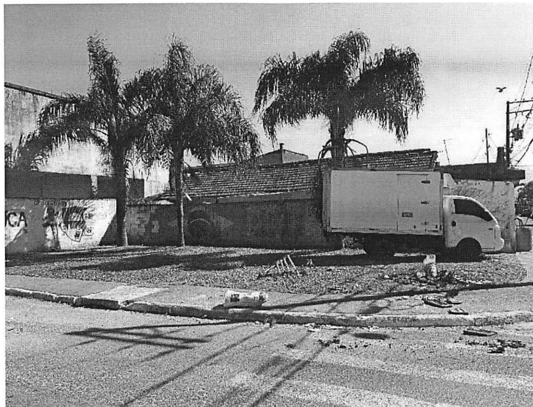
Essa as crianças pediram um campo com proteção nos muros ao redor da praça para não incomodar os moradores e traves .