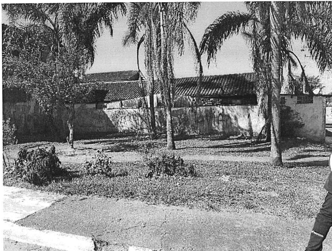
Nesta praça mesas e banquinhos de concretos para dias de lazer para nossos velhinhos de xadrez e dama ☺