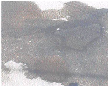
(Vazamento de água, nº.199)