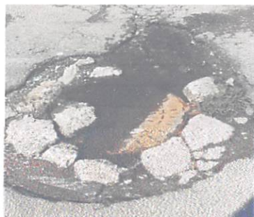
(Buraco próx. ao nº.525)

Diversos munícipes me procuraram para relatar o problema da rua, que está com diversos buracos e vazamento de água tratada (como mostram fotos anexas), causando acúmulo de água – consequente desperdícios –, danos aos veículos, além do risco iminente de acidentes, e transtornos a ciclistas e pedestres.