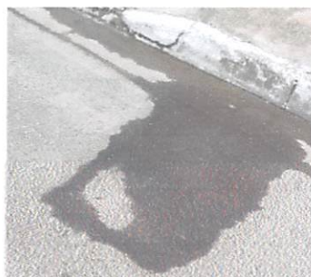
(Vazamento de água, nº.229)