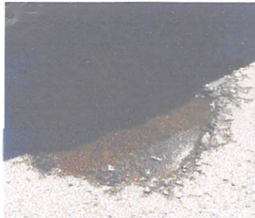
(Buraco próx. ao nº.655)