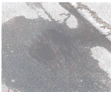
(Vazamento de água nº.202)